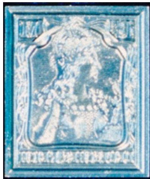
Linkes „Urstöckel“ aus der Kassette für den Wert zu 1 ¼ Mark