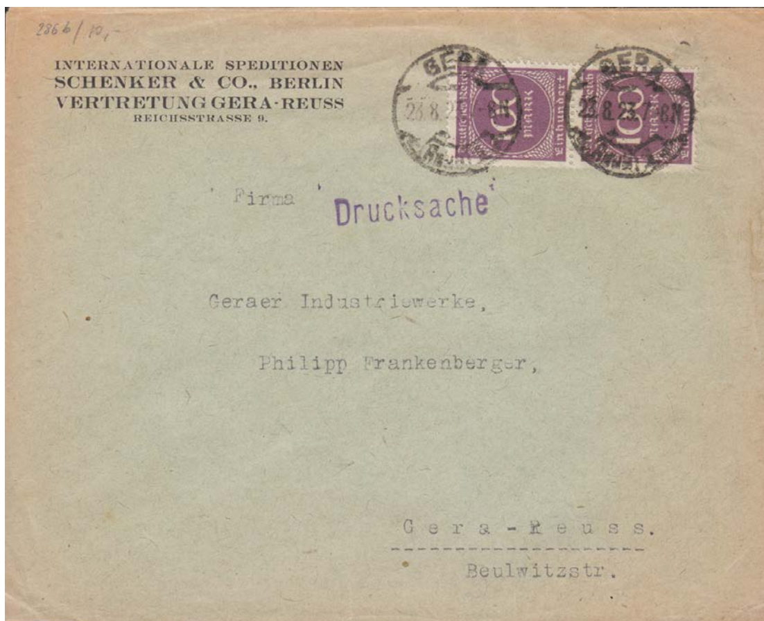
Drucksache bis 25g, 2x268b, 10.8.1923