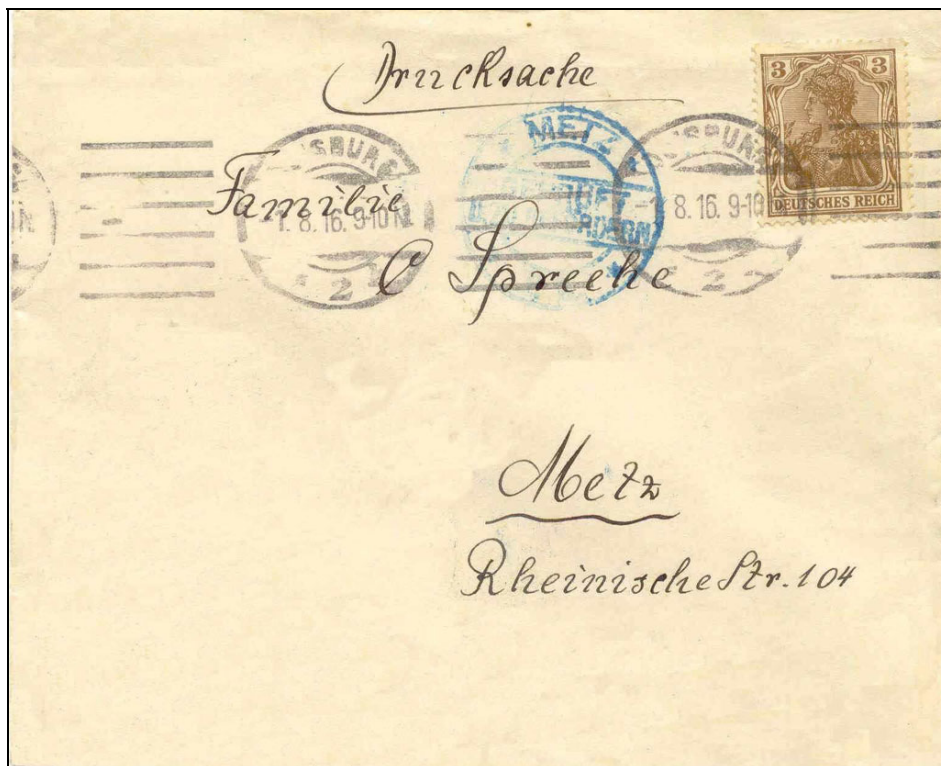
Drucksache bis 50g, 84 IIa, 1.8.1916 (PP-Ersttag)