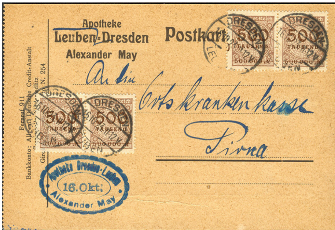
Fernpostkarte, 4x313, 16.10.1923

Die Fernpostkarte kostete nun 2 Millionen Mark und das Porto war auf vielfältige Art realisierbar, z.B. mit vier Marken je 500.000 Mark, aber da diese Marke verspätet an die Schalter kam, sind derartige Frankaturen nicht sonderlich häufig zu finden.