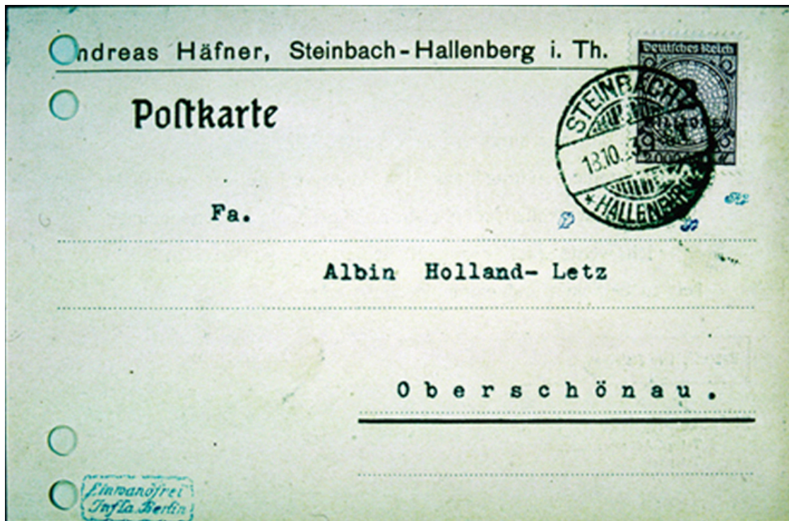
Fernpostkarte, 315 AWa, 13.10.1923

Belege mit MiNr. 315 sind auch nicht häufig zu finden, denn die Wertstufe 2 Millionen war ab Anfang Oktober in Form der Überdruckmarken 309 bis 312 bereits an den Postschaltern vorhanden. Eigentlich kam diese Marke auch verspätet an die Postschalter. Einzelfrankaturen der 315 sind daher schon große Raritäten.