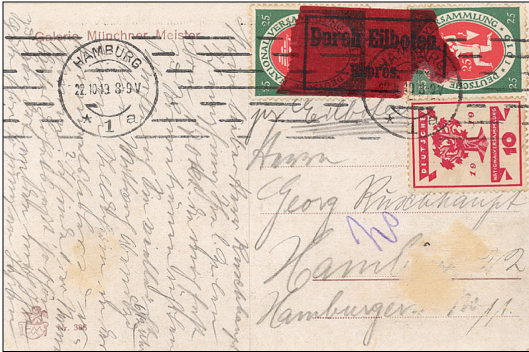
Eil-Ortspostkarte, 2x109 + 107, 22.10.1919

Hier eine Ortspostkarte, die es ganz eilig hatte, auch etwas, das nicht häufig vorkommt.