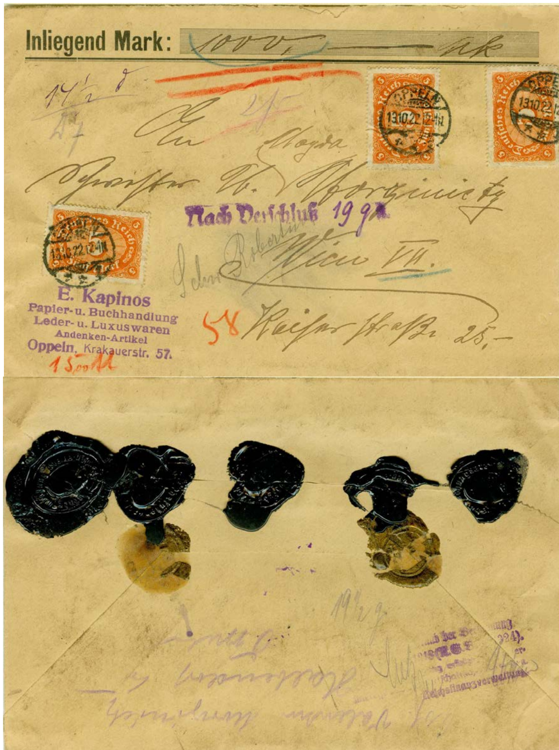
Wertbrief bis 20g, 3x194, 13.10.1922