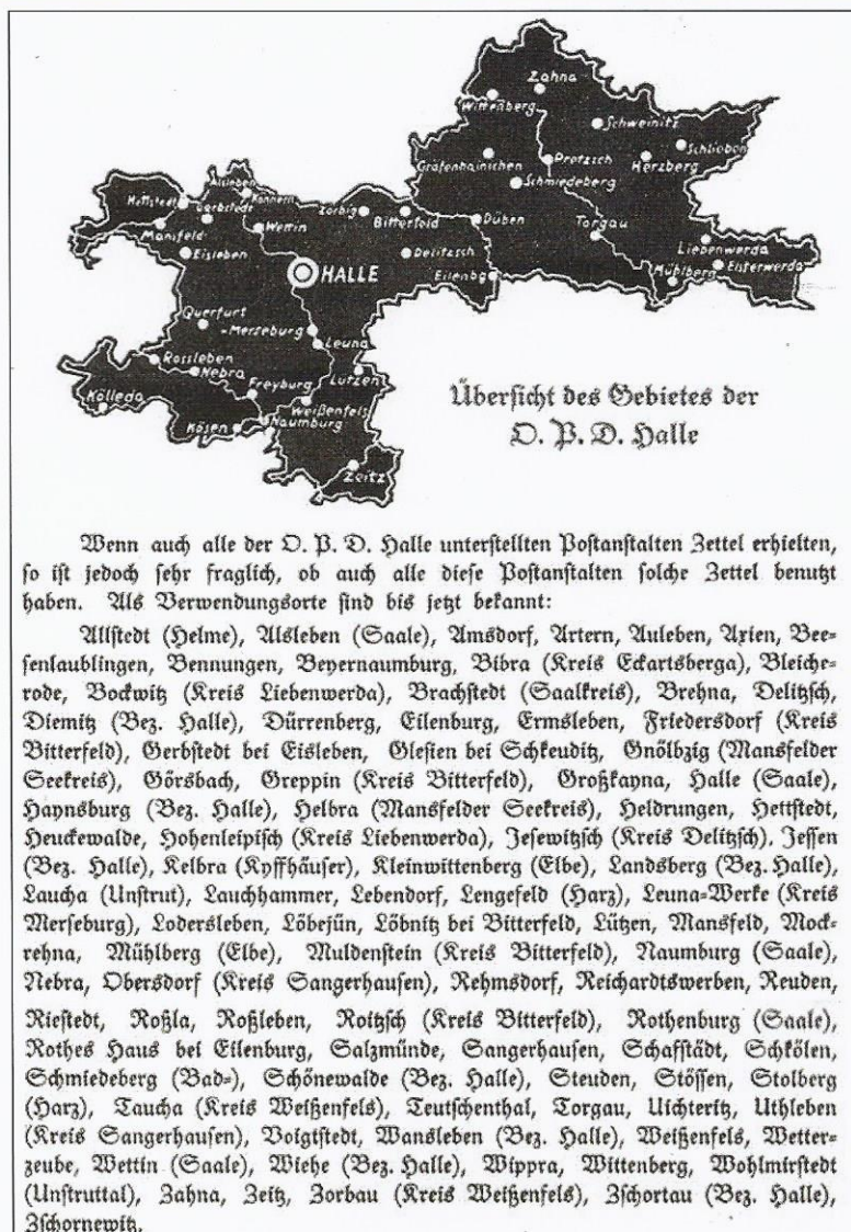
Postmeisterstempel „Heinz“ (siehe Seite 44)