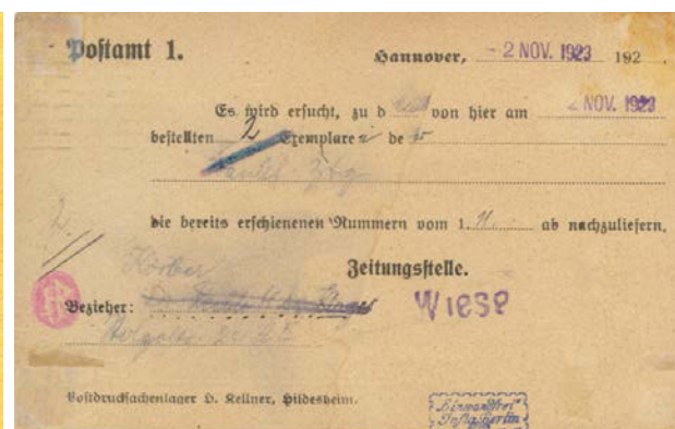
Zeitungssache zur Nachbestellung von 2 Zeitungen mit EF MiNr. 321 B vom 3.11.23

Eine weitere Zeitungssache aus der Portoperiode 4 (1.–4.11.23) mit EF der 321 B ist bekannt und registriert.