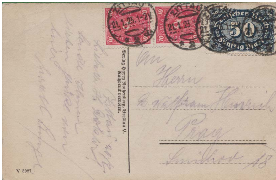
Auslandspostkarte, 21.1.23, 1-2 V

(Geschrieben am 20.1.23. Entweder hat der Absender den Postbeamten nachts aus dem Bett geklingelt oder es liegt eine Fehleinstellung der Uhrzeit vor)