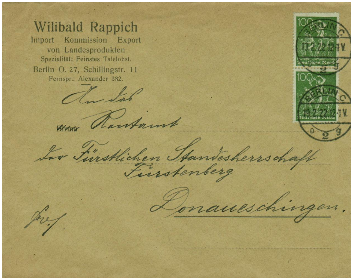
Fernbrief, 19.2.22, 12-1 V