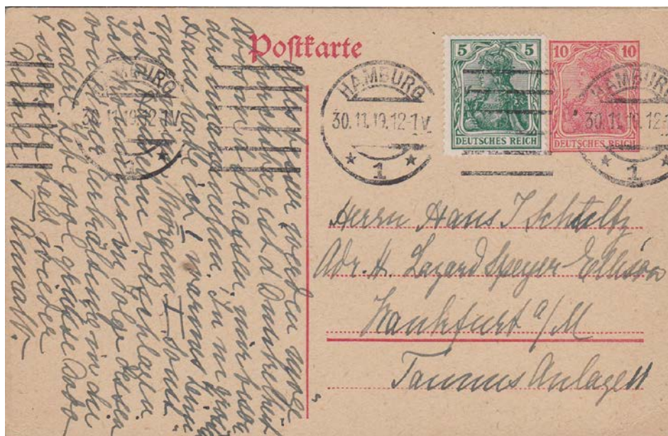
Fernpostkarte, 30.11.19, 12-1 V