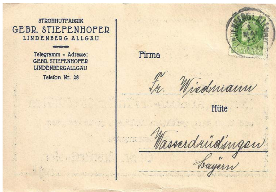
Letzttag der Übergangszeit MiNr. BY 112A LINDENBERG i. ALLGÄU 5.5.20