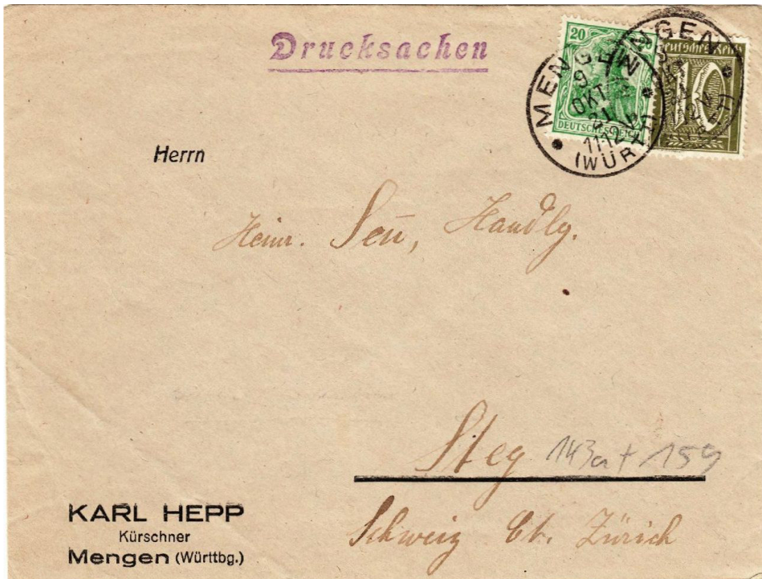
Drucksache, 9.10.1921, 11-12 V