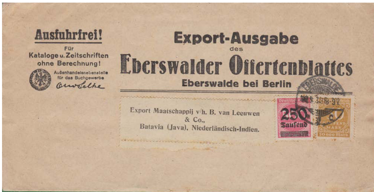
Streifband, 30.9.1923, 8-9 V