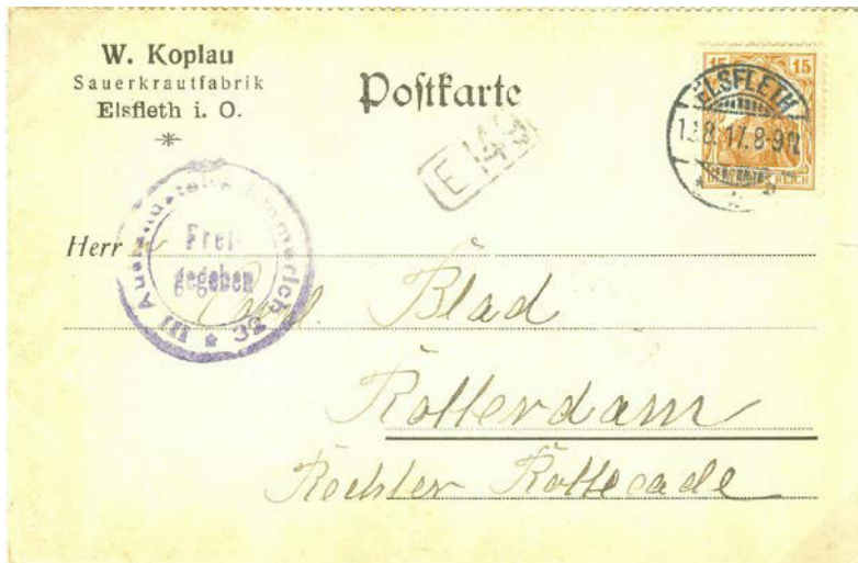
Postkarte, 12.8.1917, 8-9 N

Postkarten, teils mit den Zensurvermerken sofern sie aus der Kriegszeit stammen.