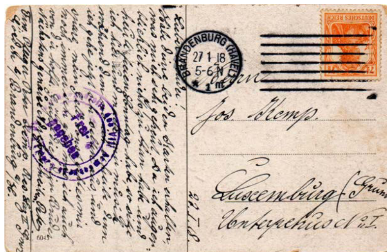
Postkarte, 27.1.1918, 5-6 N