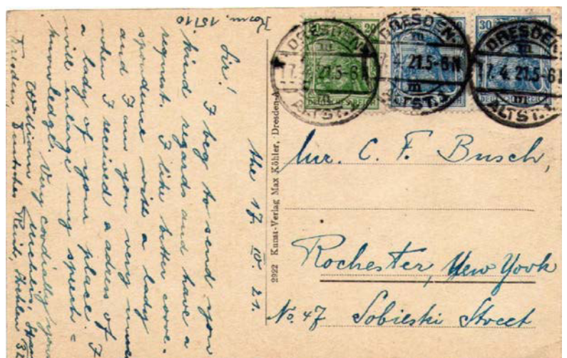
Postkarte, 17.4.1921, 5-6 N