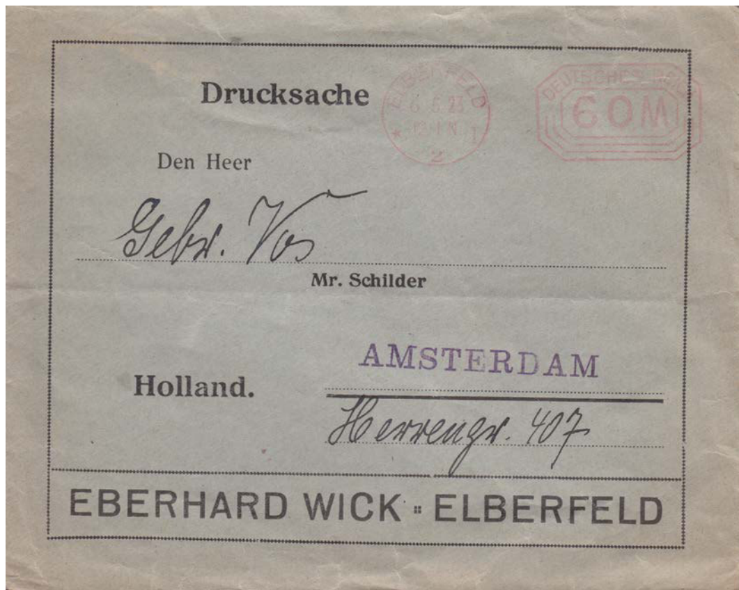
Drucksache mit Postfreistempel, 6.5.1923