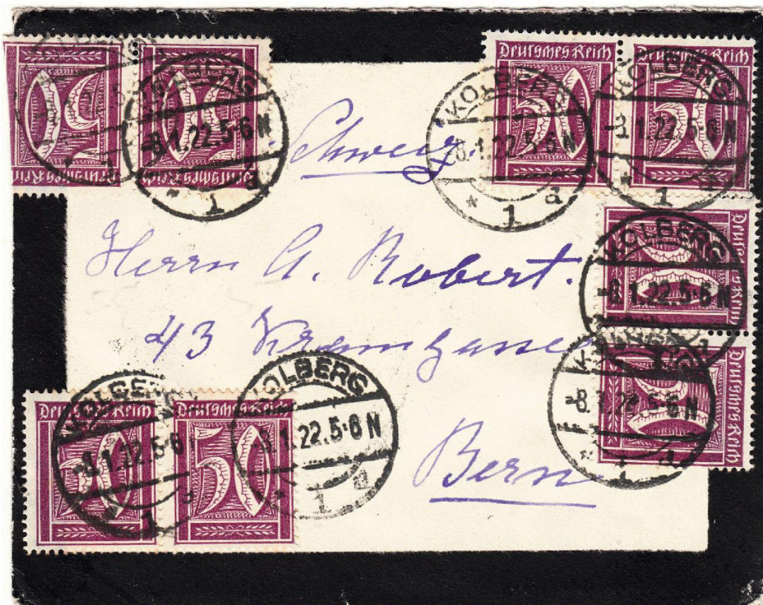
Kondolenzbrief, 8.1.1922, 5-6 N