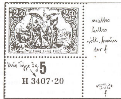
Typpe 3g der 4.